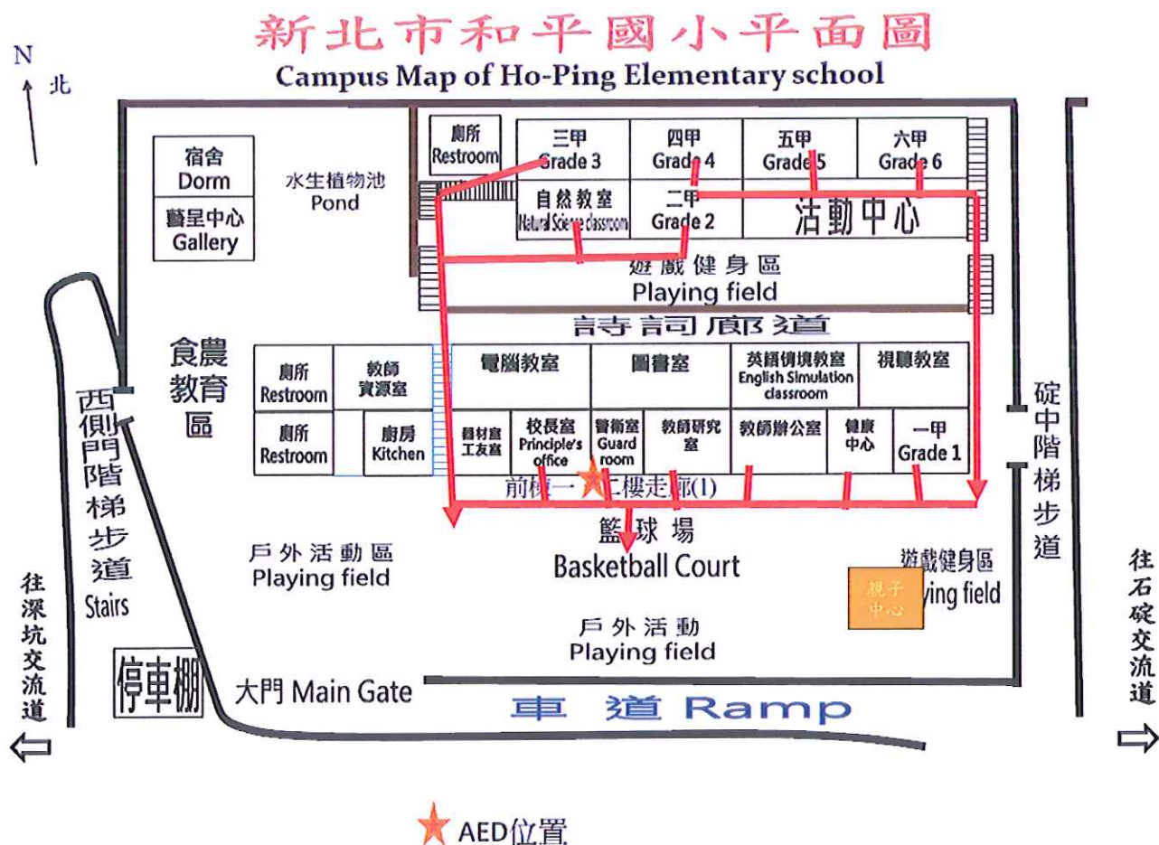
壹拾、校園災害避難逃生路線圖